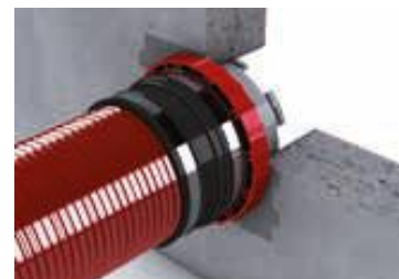
Systémová vložný díl s manžetou

Dělené kompaktní těsnění s výměnným vnitřním dílem pro použití v těsnícím rámu 150. Vhodné i pro následné dotěsnění.