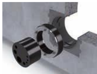
Systémová sada Bajonet 150

Ve standardním provedení dodáváme systémový vložný díl s teplotně smršťovacími objímkami. Volitelné je dodání včetně studených smršťovacích objímků.