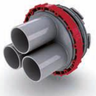
Systémový vložný díl

Bajonetový systém umožňuje snadné a rychlé napojení systémového vložného dílu nebo kabelové chráničky do těsnícího rámu a tím je dosaženo spolehlivého prostupu. Jednodušeji už kabely nenapojíte. Standardně se tento systém dodává s teplotně smršťovanými