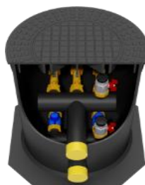
přímé provedení - 180°