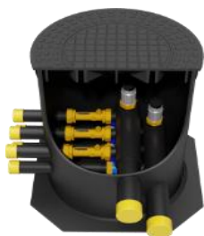
výstupy na jednu stranu - pravé provedení