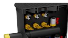
Volitelné odvodušnění pro koaxiální sondy