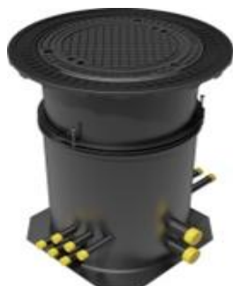
GEO 640-H s integrovanou ochrannou proti vyplavení - KLB

Řešení pro menší objekty do 10-ti okruhů