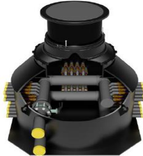
GEO-1500-H s integrovanou ochranou proti vyplavení - Flex200

Sdružovací šachta s velkým vnitřním prostorem, pro instalace do 40