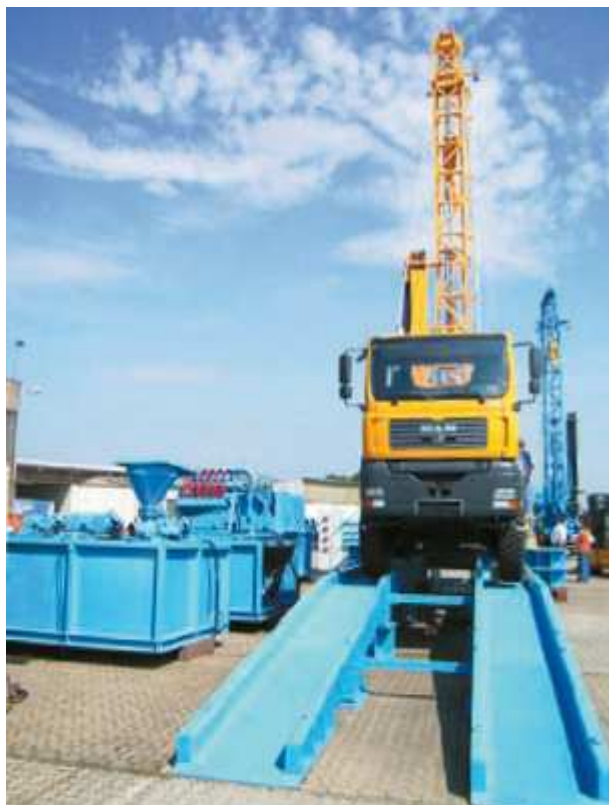
Prakla-univerzální vrtné stroje s systémem výplachových nádrží

K namíchání těchto produktů se osvědčili injektory, které jsou poháněny výplachovým čerpadlem umístěným přímo na vrtném zařízení.