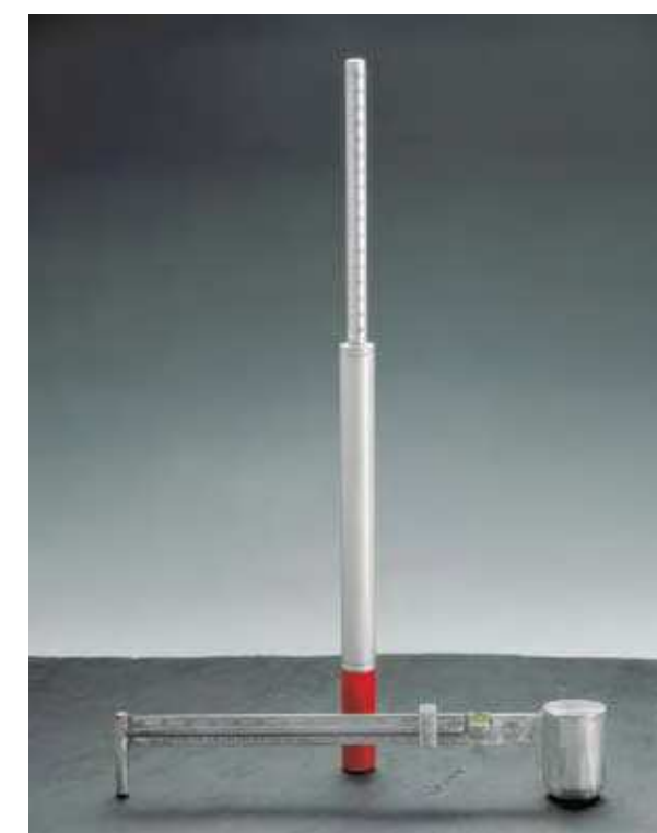
Výplachová váha, hydrometer