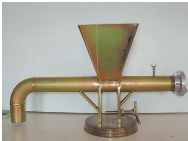
Injektor pro namíchání polymerového výplachu

Ve vztahu k pořadí namíchaných složek je potřeba dát pozor, aby přišel vždy nejprve Bentonit do vody bez polymerů. Minimální doba bobtnání je 1 hodina, teprve poté se přidávají polymerové složky.