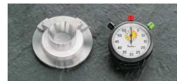
Prstec s filtračním papírem, stopky