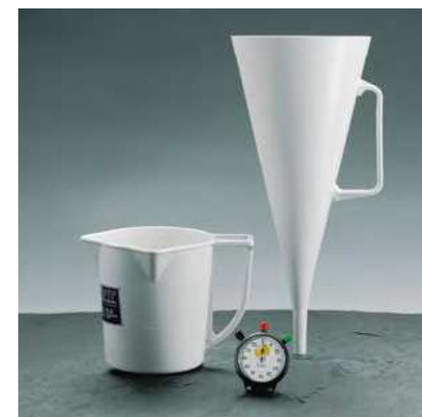
Marshův trychtýř, měřicí nádoba

Doporučená hodnota nezátíženého výplachu: < 1,10 kg/l.