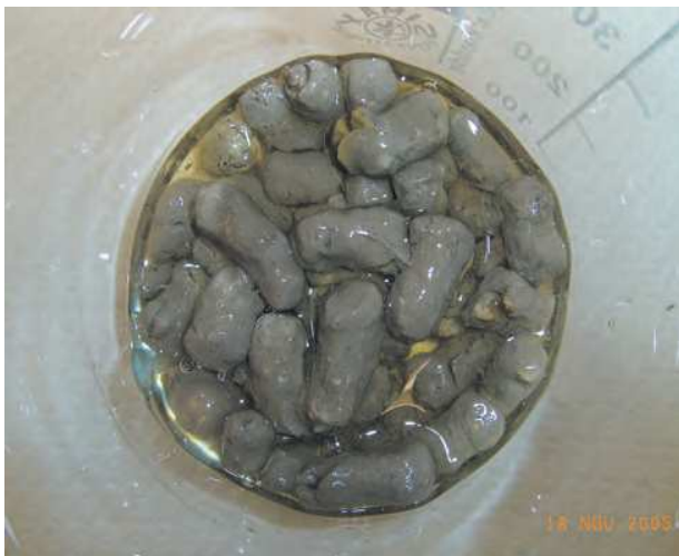
vzorek po 24 hodinách ve Viskopolu