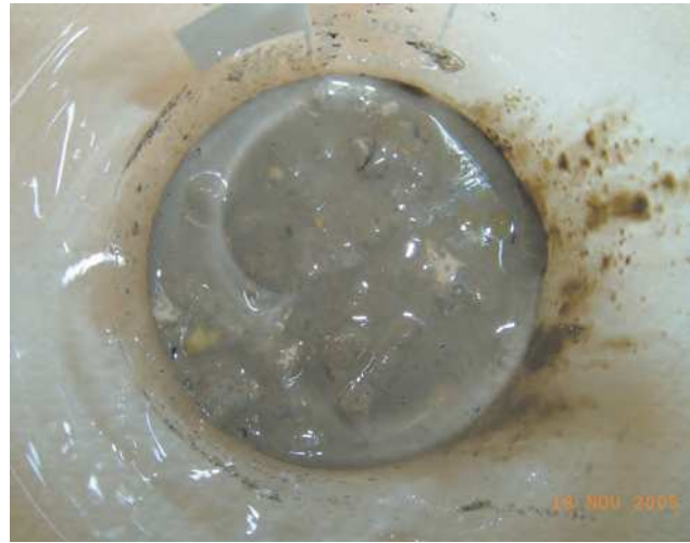
vzorek po 24 hodinách ve vodě