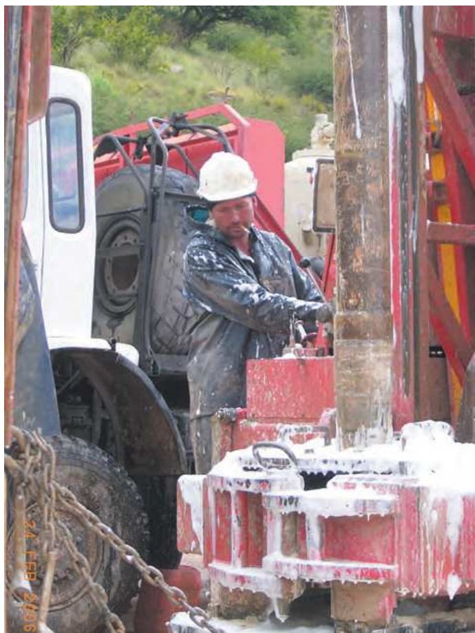
Pěnový výplach pro vrtání kladivem v pevné hornině

Ve střídavých ložiskách z písku, šterku a jílu, obzvlášť když se blízko povrchu nachází hrubý písek a šterk, je na místě použití bentonito-polymerového výplachu. Z pravidla se bentonit používá pouze při prvním nasazení výplachu a potom se provede doplnění objemu polymerním roztokem neobsahujícím pevné části, protože také zde při natrefení na soudrzný sediment dochází k přimíchání navrtaného jílu do výplachu.