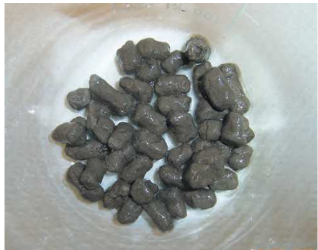
vzorek po 24 hodinách v osoleném Viskopolu